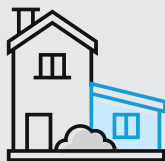
Umbau, Anbau & Aufstocken