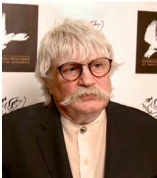
Karl Jenkins (2017)

Sir Karl Jenkins wurde 1944 in einem kleinen Fischerort in Süd-Wales geboren. Er erhielt schon früh Klavierunterricht von seinem Vater, der im Ort Lehrer, Organist und Chorleiter war und der ihn mit seiner eigenen Passion für Bach ansteckte, dessen Musik wiederum Karl Jenkins sein Leben lang inspirierte. Ein weiterer prägender Musikstil kam hinzu, als er als Sechzehnjähriger zum ersten Mal in der Schule Jazz hörte, der von da an einen großen Teil seines weiteren Lebenswegs bestimmen sollte. Seine professionelle Musikerkarriere begann er als Erster Oboist im walisischen Nationalorchester. Er studierte an der Universität Cardiff und an der Royal Academy of Music in London, wo er in Musik promovierte.